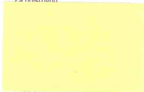
riaditeľ krajskej pobočky Všeobecnej zdravotnej poisťovne, a.s.